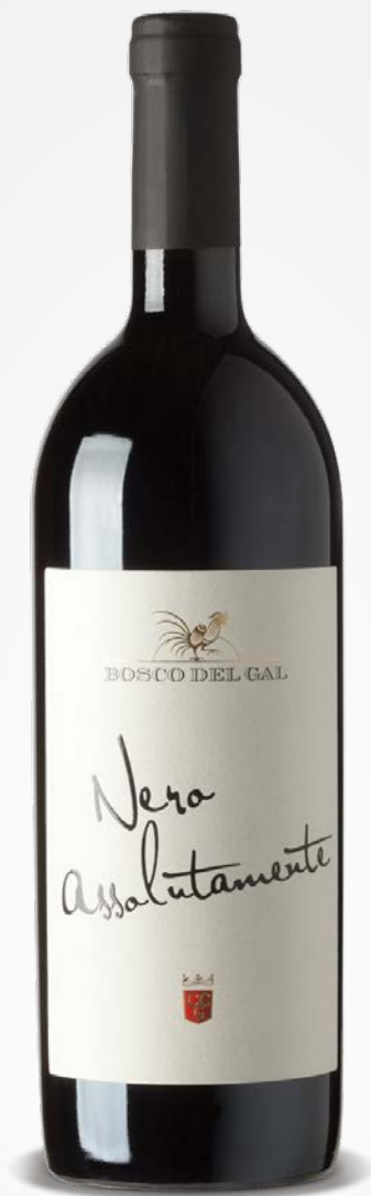
Bosco del Gal MERLOT VENETO IGT NERO ASSOLUTAMENTE