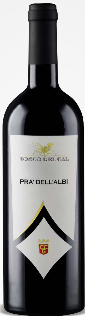
Bosco del Gal BARDOLINO SUPERIORE DOC CLASSICO PRA' DELL'ALBI