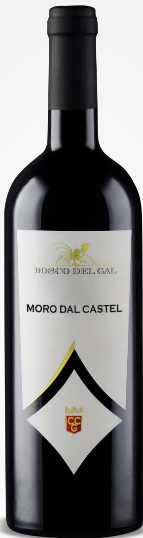
Bosco del Gal CABERNET SAUVIGNON VENETO IGT MORO DAL CASTEL