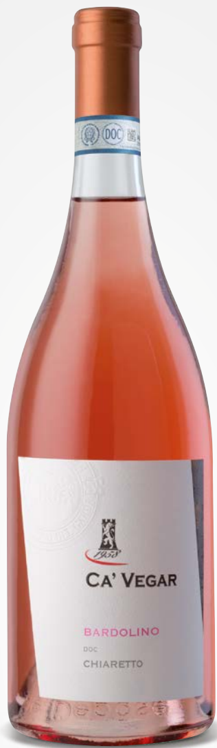
Ca' Vegar BARDOLINO CHIARETTO DOC