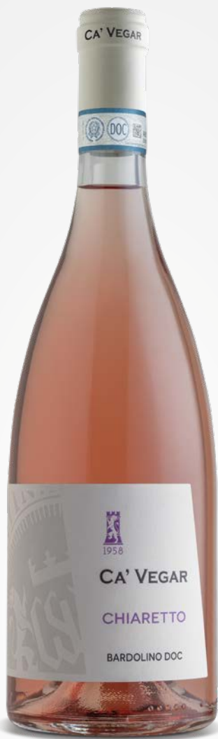
Ca' Vegar BARDOLINO CHIARETTO DOC