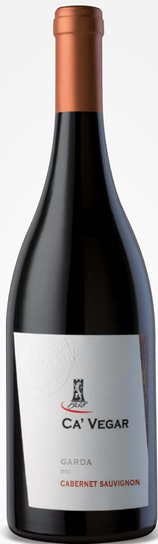
Ca' Vegar GARDA DOC CABERNET SAUVIGNON