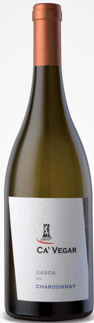
Ca' Vegar CHARDONNAY GARDA DOC