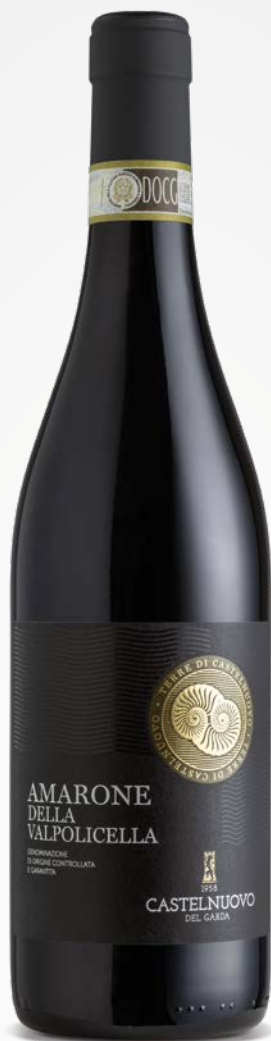
Terre di Castelnuovo AMARONE DELLA VALPOLICELLA DOCG