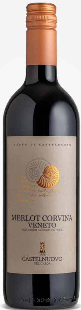
Terre di Castelnuovo MERLOT CORVINA VENETO IGT