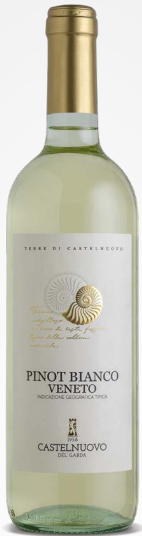
Terre di Castelnuovo PINOT BIANCO VENETO IGT