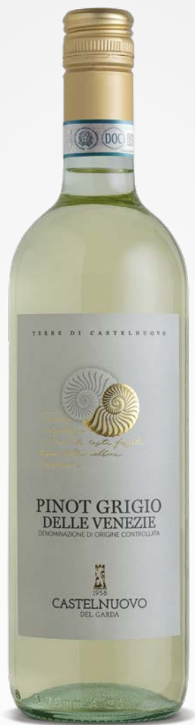
Terre di Castelnuovo PINOT GRIGIO DELLE VENEZIE DOC